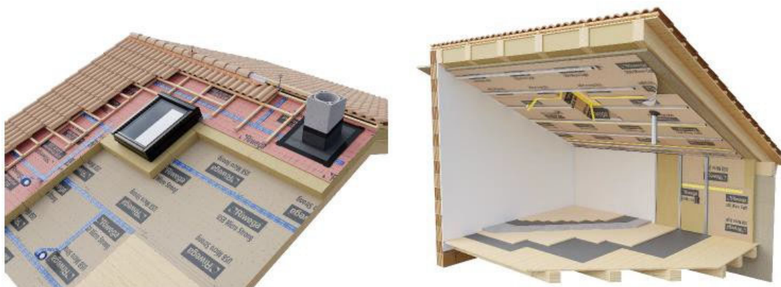
Figura 7 Esempi di stratigrafie con schermi al vapore (freni o barriere al vapore situati sul lato interno del pacchetto isolante) e membrane traspiranti (situate sul lato esterno del pacchetto isolante).

* I indica il valore di resistenza della membrana non invecchiata, mentre II indica il valore dopo l'invecchiamento